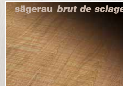
sägerau brut de sciage

Lorsque sa surface est brossée, le bois tendre situé entre les cernes annuelles est enlevé par un procédé mécanique. Il en résulte de légères rainures, ce qui produit un effet de surface intéressant et moderne. Le toucher du sol fini est aussi beaucoup plus vivant, car la structure du bois est nettement plus facile à sentir. Les effets de couleur deviennent en outre mieux visibles sur cette surface.