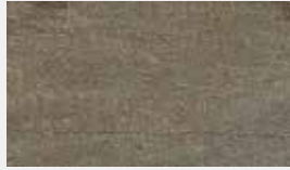
Verde Gris – Glimmer Dessin-Nr. 14702