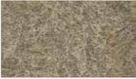
Auro – Glimmer Dessin-Nr. 14700